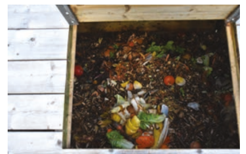
Le compostage : une pratique qui nous concerne tous.