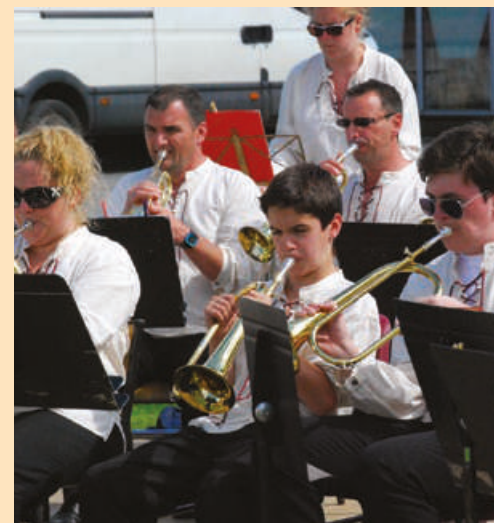
La musique sera présente tout au long du week-end de la Pentecôte.

Le festival des fanfares va vivre sa 6 ème édition. Un événement majeur pour le territoire des Hauts du Perche qui s'apprête à voir passer des formations musicales tout au long du week-end de la Pentecôte. 2024 est donc l'année des retrouvailles avec le public.