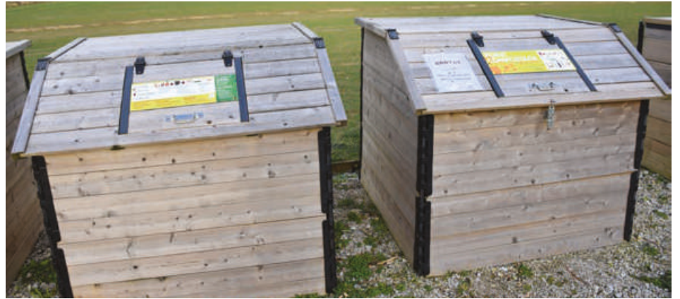
Voici à quoi ressemblent les composteurs collectifs installés dans les quartiers.

La loi Anti-Gaspillage pour une Économie Circulaire (AGEC) en date de février 2020 impose aux collectivités de proposer des solutions de tri à la source des biodéchets pour tous : ménages, professionnels ou encore collectivités. Comment cela se traduit-il aujourd'hui sur la commune de Longny-les-Villages ? Depuis peu, les élus sont en discussion avec le SMIRTOM du Perche ornais pour savoir ce qui peut être fait sur le terrain. Le compostage permet de réduire significativement le coût de la collecte, du transport et du traitement des biodéchets. Le saviez-vous ? Aujourd'hui, les biodéchets jetés dans les ordures ménagères reviennent à 289 € la tonne pour le SMIRTOM du Perche ornais. Ce chiffre