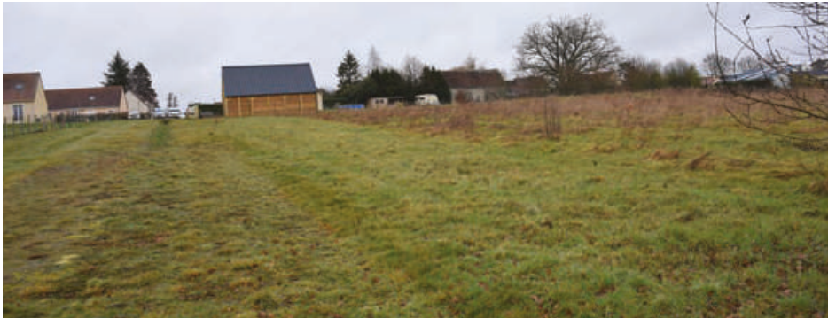
C'est en contrebas du lotissement du Minerai que le futur projet va voir le jour à Neuilly-sur-Eure dans un endroit calme.

2024 marque le lancement de deux programmes de travaux. Le premier à Neuilly-sur-Eure, le second à Longny-au-Perche.