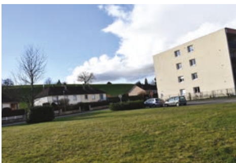
Depuis la démolition de la tour rue du Port Mahon, le site était resté en l'état.