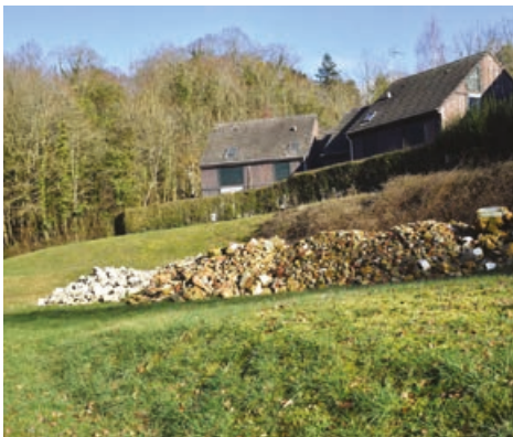
Rue de Milverton, les nouveaux logements seront édifiés dans la continuité du lotissement qui date des années 2000.