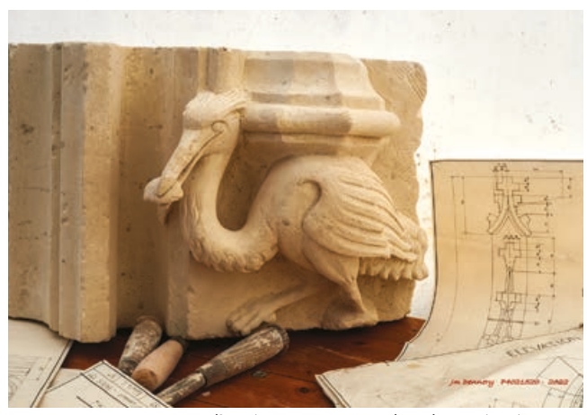
Les JEMA permettent d'avoir un autre regard sur le patrimoine vivant du territoire.

Pratique : salle des Fêtes de Longny-au-Perche - les 5, 6 et 7 avril 2024 de 10h à 18h