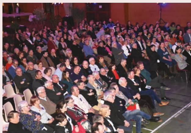
Une assistance nombreuse et attentive.

2024 sera l'année des zones d'activités : « La viabilisation de l'extension de la zone des Réhardières à Longny va démarrer, » avec des parcelles disponibles à la vente dès le mois juin. Et de lancer au chefs d'entreprises et artisans présents : « Avec nos 5 zones d'activités, nous sommes là pour vous accompagner afin que vous trouviez le meilleur endroit pour installer ou développer votre activité. » Porte d'en-