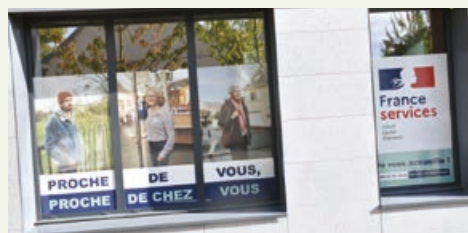
« France Services » se veut au plus près des usagers.

Les chiffres confirment que la structure est de mieux en mieux identifiée par les usagers et par les partenaires. En lien avec les élus du territoire, les agents de l'équipe « France Services » travaillent depuis plusieurs mois à l'amélioration de la couverture territoriale du service. En effet, jusqu'à présent, les agents « France Services » intervenaient exclusivement au sein de l'espace situé dans les locaux de la CdC des Hauts du Perche à Longny. Afin de tendre vers une meilleure couverture territoriale du dispositif et de faciliter l'accès du service aux personnes vulnérables et/ou en difficulté de mobilité, de nouveaux créneaux horaires vont être proposés au plus près des habitants. A partir du mois d'avril, des permanences délocalisées quelques après-midis par mois vont démarrer dans des espaces prêtés par des communes qui répondent à tous les critères en