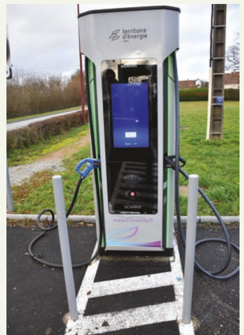
La borne de recharge au bord de la RN12

Charencey sont en service. Quelles sont les caractéristiques d'une borne « très haute puissance » ? Elle apporte une solution aux voitures de plus en plus performantes et à leur autonomie grandissante. Le mode de charge à gros débit « ultra rapide » jusqu'à 160 kW permet de réduire le temps de charge dans un délai pouvant se limiter à environ quinze minutes pour un plein d'électricité. Le tarif est de 0,60 €/kWh. Le temps passé supplémentaire après la recharge complète du véhicule est facturé +0,12 € la minute de connexion. La borne est accessible 24H/24 et 7j/7. Le paiement s'effectue par carte bancaire sans contact, ou avec le badge d'un opérateur de mobilité. Cet équipement représente un investissement de 148 848 € HT cofinancés à 80% par l'État soit 119 078 € (plan France Relance), les 20% restants étant pris par le Territoire d'Énergie Orne, soit 29 769 €.