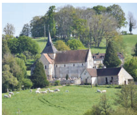
L'église d'Autheuil mise en valeur avec son Petit festival annuel.