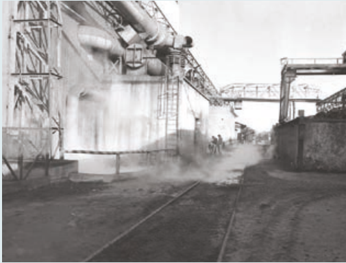
Vue de la voie ferrée dans l'usine en 1958.

La Société des fonderies et ateliers de Randonnai, connue sous le sigle SFAR, a été créée à Randonnai, petite commune de l'Orne, en 1876 par Auguste Gausselein sous le nom « Fonderie Gausselein ». Elle prend la forme de « Société des fonderies et ateliers de Randonnai » en 1948. Elle est dirigée par André Metra. La SFAR est rapidement devenue une des entreprises clés du canton de Tourouvre employant 690 personnes dans les années 1970, spécialisée dans la fonderie de pièces techniques de grandes dimensions destinées aux marchés de l'automobile et plus particulièrement pour FORD. Elle fabriquait aussi les moteurs de tracteurs. La société originelle SFAR s'est agrandie au fur et à mesure des années, avec une activité de fonderie de bronze. À sa fermeture en 1982, la SFAR comptait encore presque 400 salariés. Fin 2023, les travaux de terrassement lancés en vue de la construction d'une boulangerie ont permis de mettre à jour d'énormes blocs de béton, vestiges des anciennes fondations de la voie ferrée « L'Aigle-Mortagne ». Celle-ci arrivait à l'ancienne fonderie déconstruite dans les années 80. C'est vers la fin des années 50 que la liaison avec l'usine a été réalisée, comme en témoigne la photo d'illustration ci-dessus.