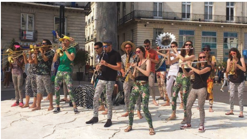
Les aubades vont faire leur grand retour dans les villages.