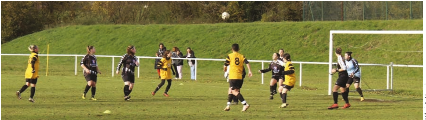
Le football féminin est en plein essor à Tourouvre