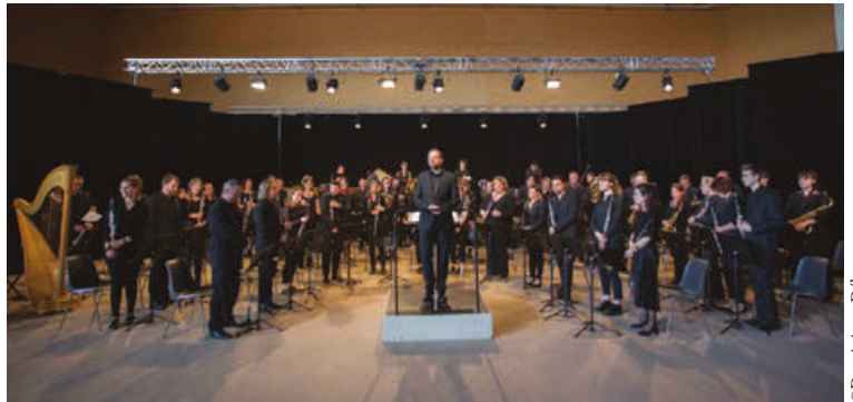
L'Orchestre d'Harmonie de la Ville de Tonnerre animera le concert de gala 2024.