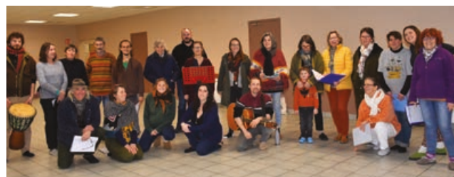
Le plaisir de s'exprimer par le chant.