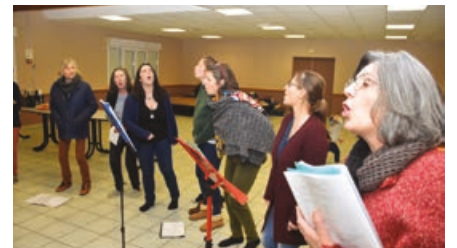
Le groupe répète dans la joie et la bonne humeur.