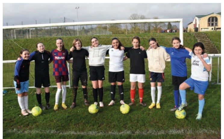
Les U13 sont ravies. Elles vont participer au mois de mai à leur première finale départementale.