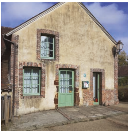
La salle Robert Giffard, un lieu culturel essentiel sur la commune.