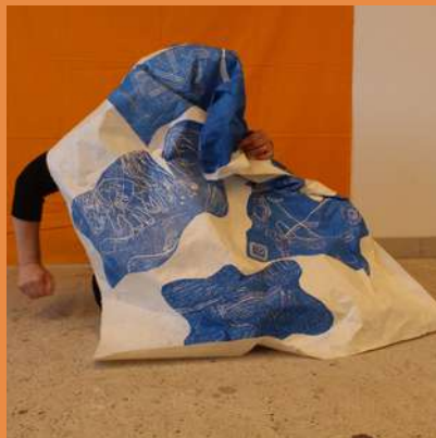
Photos issues d'ateliers de pratique artistique à la Corne d'or