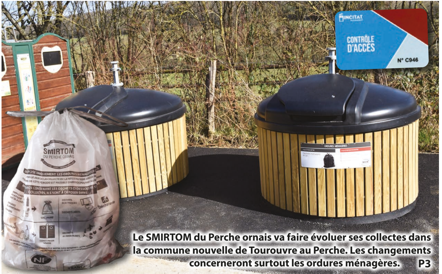
Le SMIRTOM du Perche ornais va faire évoluer ses collectes dans la commune nouvelle de Tourouvre au Perche. Les changements concerneront surtout les ordures ménagères. P3