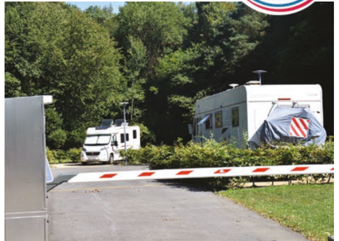
L'aire de camping-car à la sortie de la commune.