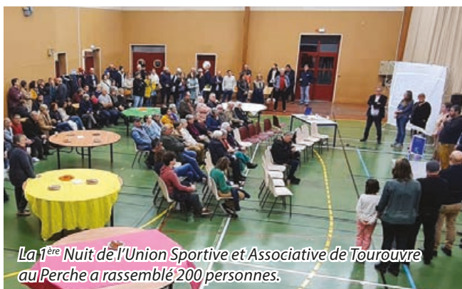
La 1 ère Nuit de l'Union Sportive et Associative de Tourouvre au Perche a rassemblé 200 personnes.