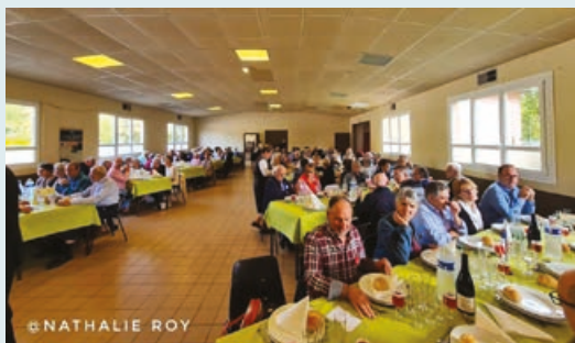
Les convives attablés pour un repas convivial.

À cette occasion, France 3 Normandie a suivi cette journée particulière pleine d'émotions.