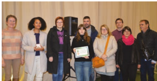
L'Harmonie de Randonnai a été récompensée pour son travail sur le territoire.