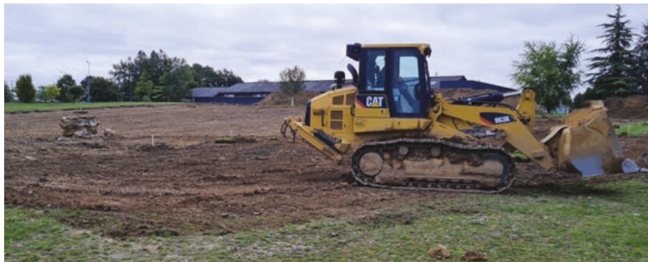
Les engins ont investi le site en septembre.