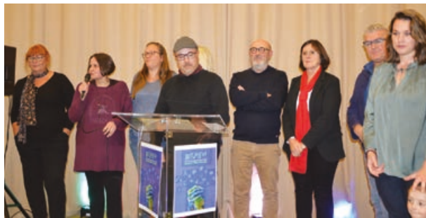
L'équipe de l'USAT organisatrice de la soirée.

La soirée s'est ensuite prolongée avec un quizz sur le monde associatif de Tourouvre au Perche puis un jeu consistant à découvrir un autre bénévole après avoir tiré au sort un papier contenant des indices sur ce dernier.