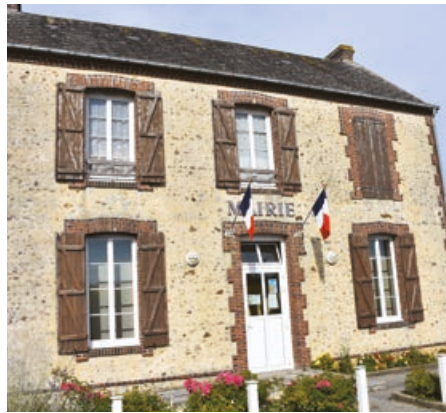
La mairie de Prépotin.

WhatsApp avec la population. Cet outil me permet de faire passer les informations très rapidement et faciliter la vie des 125 habitants. Je trouve que le contact avec les gens est facile. Quand je suis sollicité, j'essaie de répondre du mieux possible. De toute façon, à chaque fois, je prends le temps d'expliquer ma décision. Surtout quand c'est non. C'est très important de dire les choses. »