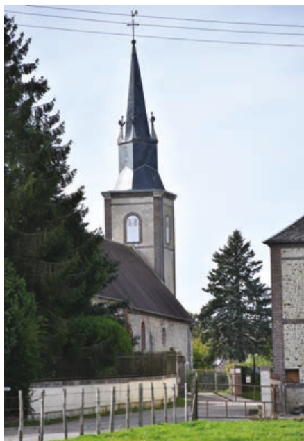
L'église au cœur du village.