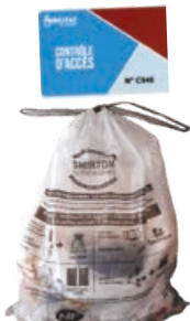
Les habitants qui n'auront pas leurs sacs ou leurs badges ne pourront plus déposer leurs ordures ménagères. Ils s'exposeront à des frais d'enlèvement.

Pour réduire l'impact écologique des déchets et maîtriser les coûts, le SMIRTOM du Perche ornaï va faire évoluer ses collectes dans la commune nouvelle de Tourouvre au Perche. Les changements concerneront surtout les ordures ménagères. A quoi peut-on s'attendre en 2024 ?