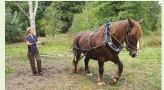
Le cheval est un fidèle soutien pour intervenir en milieu humide.

Un chantier de débardage s'est déroulé au cours du mois de septembre au sein de la Réserve naturelle régionale de la Clairière forestière de Bresolettes située sur la commune de Tourouvre-au-Perche. La réserve qui est co-gérée par l'ONF et le PNR du Perche, est située au cœur de la forêt domaniale de Perche-Trappe. Sa surface est de 757 hectares (684 hectares de forêt domaniale gérés par l'ONF et 73 hectares de terrains privés appartenant à des particuliers et gérés par le Parc).