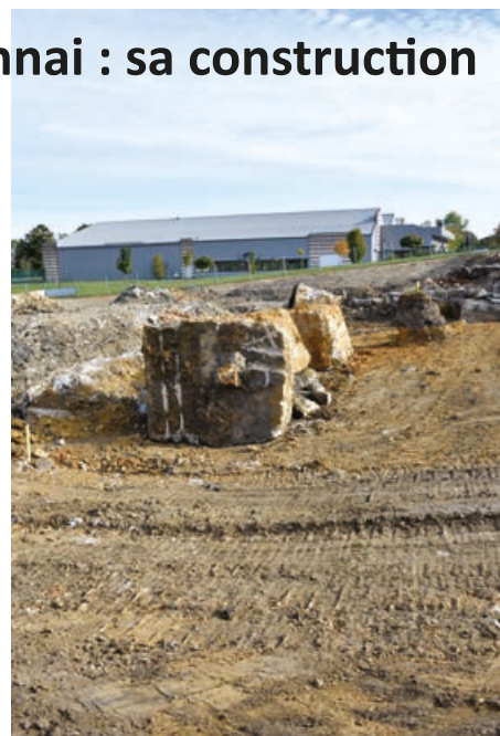
La mise à jour de blocs de béton impressionnants a marqué le début des travaux en octobre.

Le projet d'implantation d'une boulangerie et de quatre logements locatifs se précise à Randonnai. Il a été validé par le conseil municipal de Tourouvre au Perche. A l'espace Métra, face à l'agence postale et au cabinet médical, les travaux de terrassement ont débuté à la rentrée de septembre. Une première étape préalable afin de préparer le terrain à la future construction. Toutefois, le chantier a pris un peu de retard suite à la découverte d'énormes blocs de béton qui dormaient là depuis de nombreuses années sous 30 à 40 cm de terre végétale. Ces blocs sont les vestiges des anciennes fondations de la voie ferrée qui arrivait à l'ancienne fonderie déconstruite en 1981. Ils seront concassés afin de servir d'assise aux futures fondations. Projet majeur sur la commune déléguée, la construction de la boulangerie et des logements par Orne Habitat devrait s'étaler sur une année. La Foncière de Normandie, la Chambre de commerce et d'industrie et la commune se chargeront de trouver un artisan boulanger.