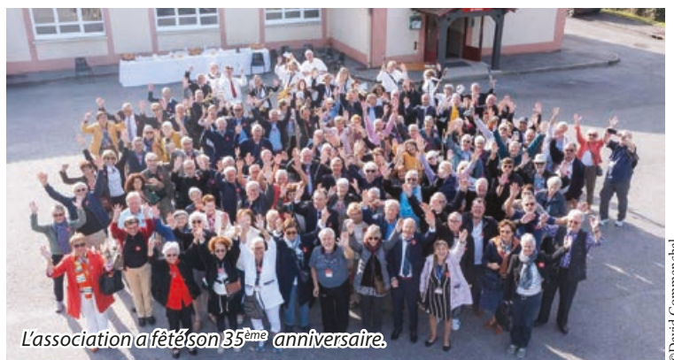
L'association a fêté son 35 ème anniversaire.