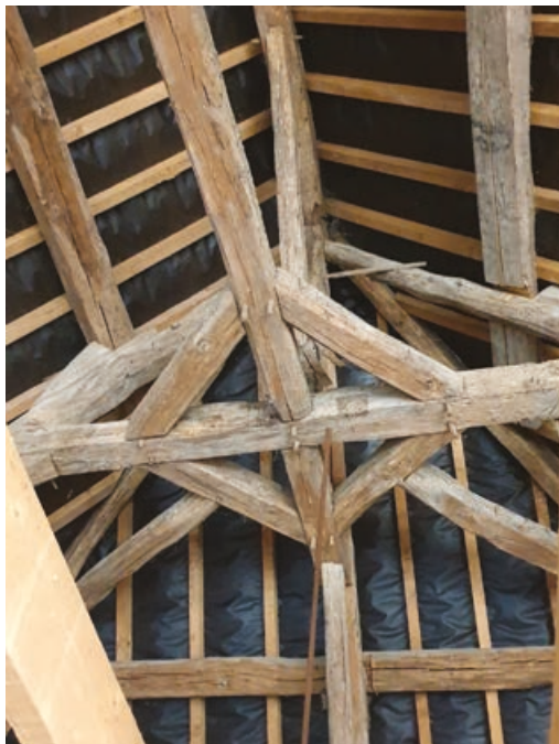
Les travaux de réfection de la toiture ont permis de mettre à jour une magnifique charpente.

vaux avancent bien. « Nous sommes dans les temps, » explique le Dr Fabre. Sauf imprévu, le cabinet médical devrait ouvrir ses portes en mai-juin 2024. Beaucoup reste encore à faire, comme l'aménagement des bureaux des praticiens, la création d'un studio pour les stagiaires et d'un T2 pour l'accueil d'un médecin remplaçant. L'installation de panneaux solaires et d'un ascenseur est également programmée. Côté rue du Général de Gaulle, la commune a acquis une petite maison mitoyenne du bâtiment principal. Elle sera démolie pour permettre la création de cinq places de parking pour les