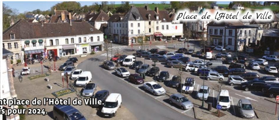
Place de l'Hôtel de Ville

Des commerces ouvrent place de l'Hôtel de Ville. D'autres sont annoncés pour 2024.