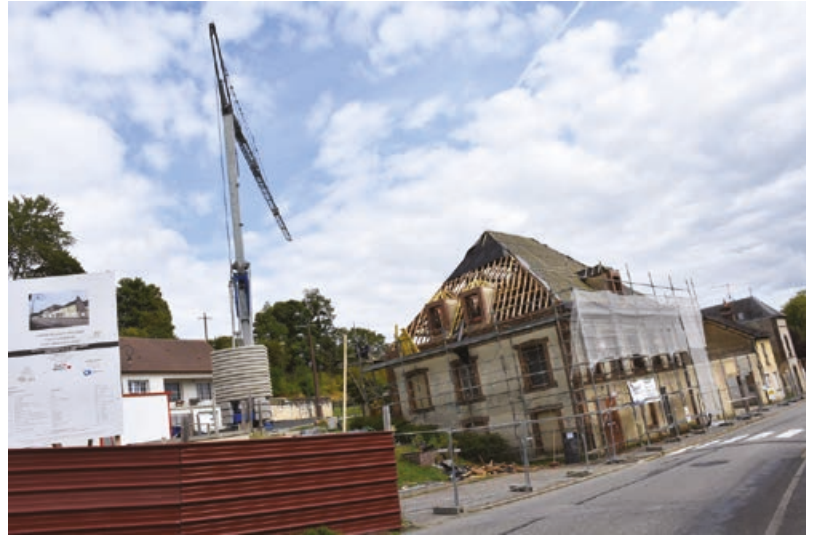
Le chantier se poursuit normalement.

Les Longnyciens ne peuvent plus l'ignorer. Les choses bougent au niveau du champ de foire. Le bâtiment de 700 m 2 acheté par la municipalité pour y installer le futur cabinet médical communal est en train d'être réhabilité. Depuis cet été, le chantier s'est accéléré. La première phase de démolition passée et le désamiantage effectué, les entreprises ont investi les lieux. Tout au long de l'été et au mois de septembre, la toiture a été restaurée. Ce fut l'occasion de découvrir « une magnifique charpente, » se félicite le Dr Bertrand Fabre, l'élus municipal référent du projet. Pour l'heure, les tra-