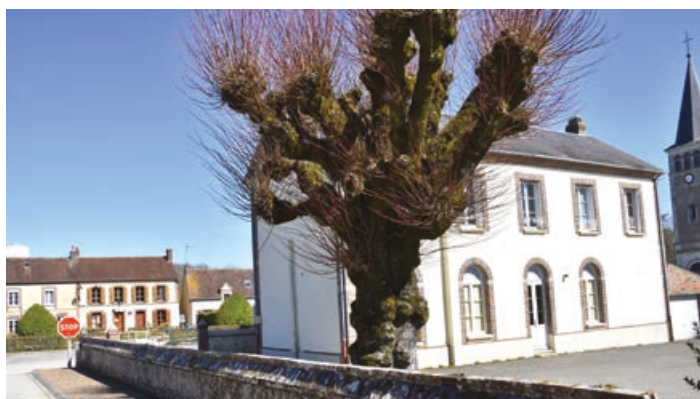
Elle a intégré le rez-de-chaussée de l'ancienne école.