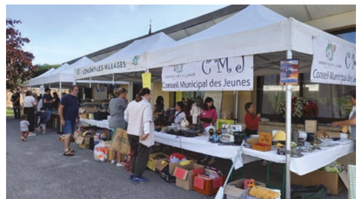
Le Conseil Municipal des Jeunes a visité l'Assemblée Nationale, participé à une brocante et choisi son nouveau maire.