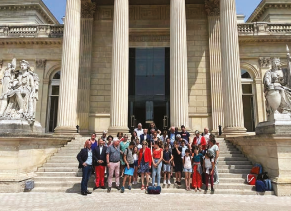
Les jeunes élus longnyciens dans l'hémicycle.

Le mercredi 28 juin, les membres du Conseil Municipal des Jeunes (CMJ) de Longny-les-Villages sont allés visiter l'Assemblée Nationale, sur une invitation de la députée Véronique Louwagie, et en compagnie du CMJ de Val au Perche et des accompagnateurs conseillers municipaux. Cette sortie a permis de découvrir le fonctionnement des instances gouvernementales et les lieux où se prennent les décisions : le Palais Bourbon avec ses ors et ses lustres a fasciné nos jeunes ; le passage dans l'hémicycle les a impressionnés.