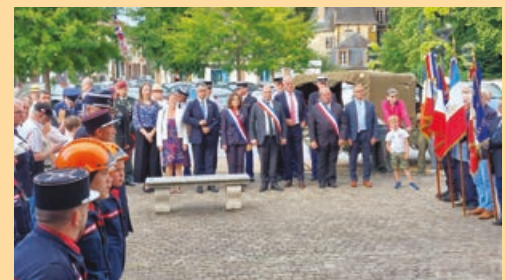
La commémoration sur le parvis de la place de l'Hôtel de Ville.