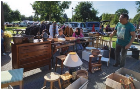
Les membres du CMJ ne sont pas passés inaperçus début septembre à Moulicent.

Dimanche 3 septembre, le CMJ a tenu un stand à la brocante de Moulicent, dont le bénéfice d'environ 600€ sera reversé au profit d'une association qui s'occupe d'enfants exilés ukrainiens. C'était en effet un projet qui tenait à cœur aux jeunes du CMJ d'organiser une brocante solidaire pour l'Ukraine, où la guerre sévit depuis février 2022. Auprès d'eux, pour les encadrer, la commission de citoyenneté s'est montrée très présente et efficace, y compris sur le travail en amont, de récupération, tri, étiquetage des objets donnés pour cette brocante. Ravis de leur journée, ils ne demandent qu'à recommencer l'été prochain ! En atten-