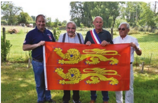
La Normandie et la Caroline du Nord désormais liée par le chemin de fer.