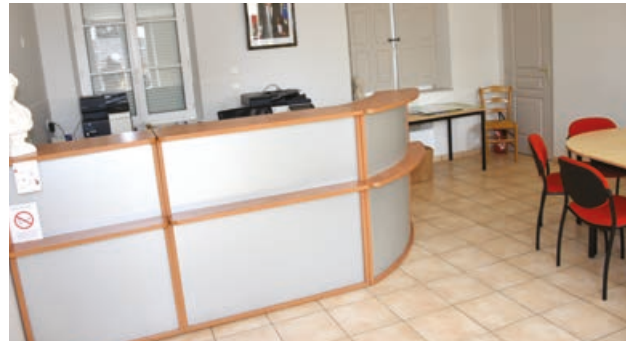
Une mairie de plain-pied, accessible et fonctionnelle.

Depuis le mois de juillet, la commune déléguée de Moulicent dispose d'une toute nouvelle mairie. L'ancienne qui par le passé « a aussi accueilli la salle des fêtes et la cantine, » se trouvait au 13 place des 4 horloges. Elle vient d'être vendue pour retourner dans le domaine privé. Un déclassement a été nécessaire avant la cession.