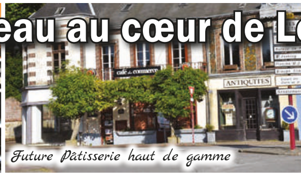
Future Pâtisserie haut de gamme