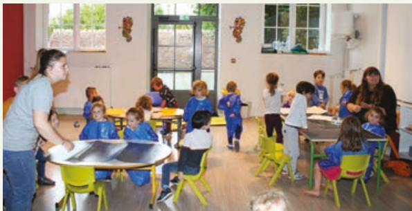
Enfants et animateurs cet été dans les espaces dédiés aux activités.

Cet été, l'accueil de loisirs de Longny a rouvert après d'importants travaux de réhabilitation. Une vraie chance pour la cinquantaine enfants inscrits qui ont redécouvert l'endroit. Le nouvel équipement où ils sont accueillis dans le cadre du centre de loisirs sans hébergement (CLSH) a bien changé. Il y a notamment cette extension qui a vu le jour augmentant considérablement la surface praticable. Elle est désormais de 500 m 2 . On y trouve le dortoir pour la sieste des tout-petits, des sanitaires et une pièce de rangement pour le ménage. Un large couloir central relie les deux entrées du bâtiment. L'agencement des pièces de l'ancienne école a également été repensé. Avec ses trois salles d'activités déjà existantes, le rez-de-chaussée est le lieu de vie où