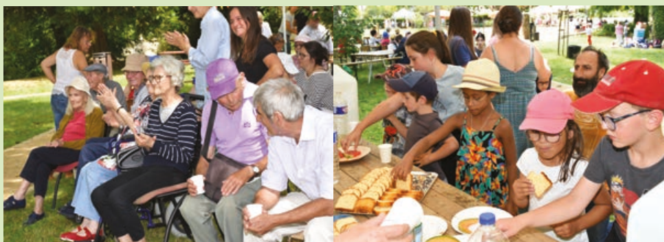
Quand les générations se retrouvent, le bonheur se lit dans les regards.

à Longny-au-Perche. Ce moment convivial, musical et ludique tout au long de l'après-midi a été très apprécié. Cette 2 ème édition devrait trouver un prolongement dès l'an prochain.