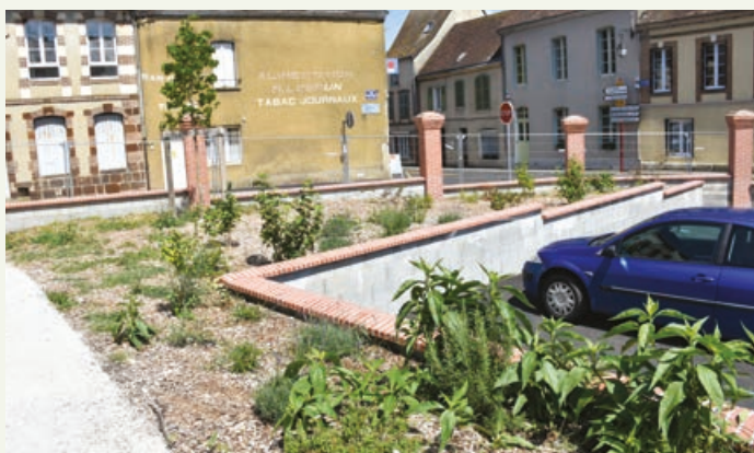
Un parking a vu le jour à proximité du carrefour.

Dans le cadre de la requalification du quartier de la Providence, l'aménagement du carrefour de l'EHPAD porté par la CdC des Hauts du Perche et la commune nouvelle de Longny-les-Villages touche à sa fin. On se souvient qu'une première phase avait permis d'ouvrir l'espace et d'éclairer les lieux suite à la démolition d'un bâtiment appartenant à L'EHPAD. Les travaux qui s'achèveront d'ici la fin de l'année ont concerné le réaménagement du carrefour RD8/RD11. Un muret surmonté de grilles a été érigé. Pour remplacer le stationnement supprimé dans la rue du Dr Jean Vivarès, un parking de dix places a été créé en retrait de l'axe de circulation. Le marquage au sol est également réalisé. Enfin, un espace vert arboré a vu le