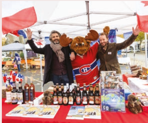
Le marché de produits locaux percheron-québécois va ouvrir le week-end dès le vendredi matin.

Initié l'an passé dans le cadre de la coopération avec Verneuil-sur-Avre et Marennes d'Oléron, le festival « Attache ta tuque » revient les 3-4 et 5 novembre dans les Hauts du Perche.