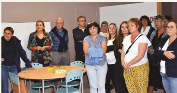
Une assistance attentive à l'heure des discours.

Le coût total de l'opération s'élève à 295 000 €. Le projet a bénéficié d'une subvention DETR (74 799 €) et du FCTVA (48 454 €).