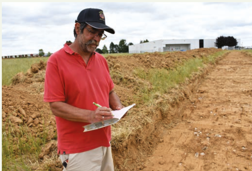
L'objectif de cette exploration s'est traduit par une série de sondages réalisée sur dix jours.

Impression : Imp. de L'Etoile - 61190 Tourouvre 02 33 85 26 70