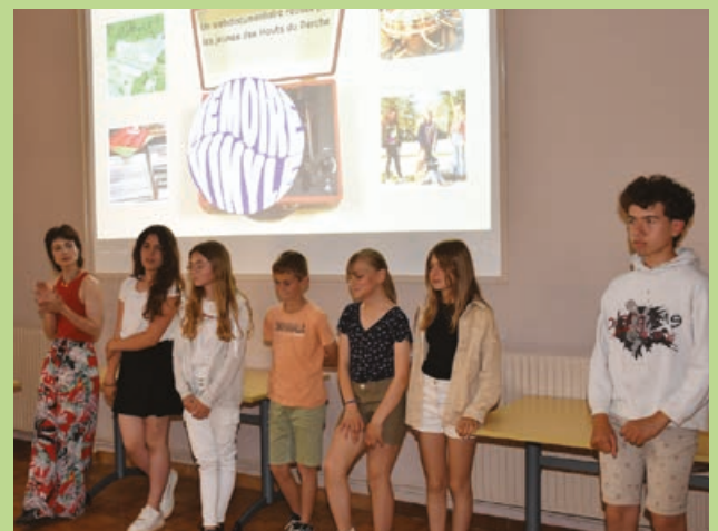
Les jeunes réalisateurs en herbe ont beaucoup appris de cette expérience riche en rencontres.

Pour découvrir le web documentaire : https://artsperches.fr/webdoc/memoire-vinyle/