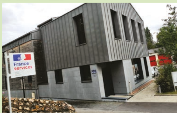
Bienvenue à la « Maison France Services ».

Le réseau « France Services » vise à permettre à chaque citoyen, quel que soit l'endroit où il vit, en ville ou à la campagne, d'accéder aux services publics et d'être accompagné par des personnes formées et disponibles pour effectuer ses démarches du quotidien : emploi, santé, famille, retraite, impôts, accès au droit, etc.