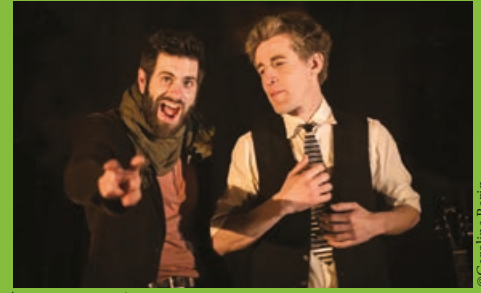
Les acteurs sur scène.