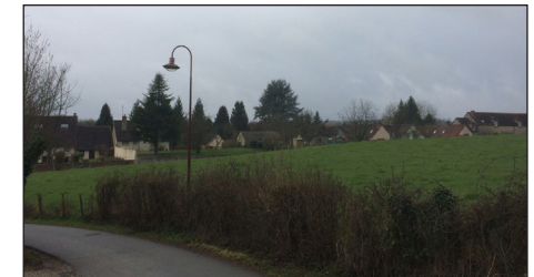
Vue sur les toitures de la Grande-Rue