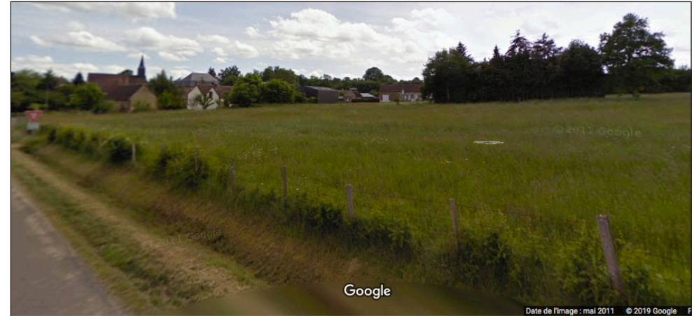
Un environnement boisé favorisant l'intégration paysagère

Un bourg qui s'est étiré le long de la route départementale.