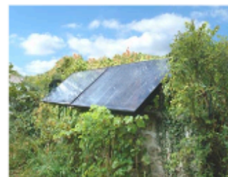
Les capteurs thermiques sont adossés à un mur du jardin. Cette solution demande une surveillance de la croissance de la végétation pour éviter toute ombre portée. Vigny (Val d'Oise)

S'il s'avère difficile d'implanter les capteurs en toiture ou en façade (orientation défavorable, surface réduite, intérêt architectural à préserver), ils peuvent être isolés de la construction et posés au sol, ou adossés à un mur.