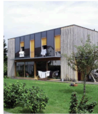
Les capteurs posés verticalement participent pleinement de la composition de la façade. Maison individuelle à Wolfurt (Vorarlberg, Autriche) © CAUE 78

Les capteurs thermiques suivent la logique de composition des volumes de cet ensemble d'habitat collectif. Montigny-le-Bretonneux (Yvelines). © CAUE 78