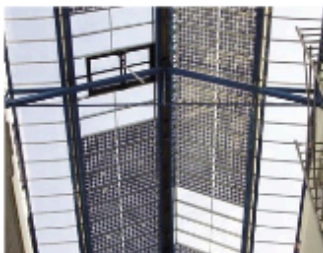
Les capteurs photovoltaïques sont intégrés à la verrière de la galerie de distribution d'une résidence HLM. L'Isle d'Abeau (Isère)

Les capteurs photovoltaïques semi-transparents peuvent être intégrés dans une verrière, un mur-rideau et ainsi diffuser la lumière.