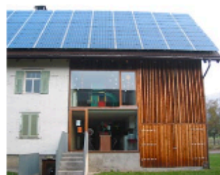
Un ensemble de capteurs recouvre toute la surface du toit, comme une nouvelle couverture. Crèche à Zwischenwasser (Vorarlberg, Autriche)

Une nappe de capteurs photovoltaïques assemblés peut, dans des cas particuliers, venir en surtoiture ou jouer directement le rôle de couverture.