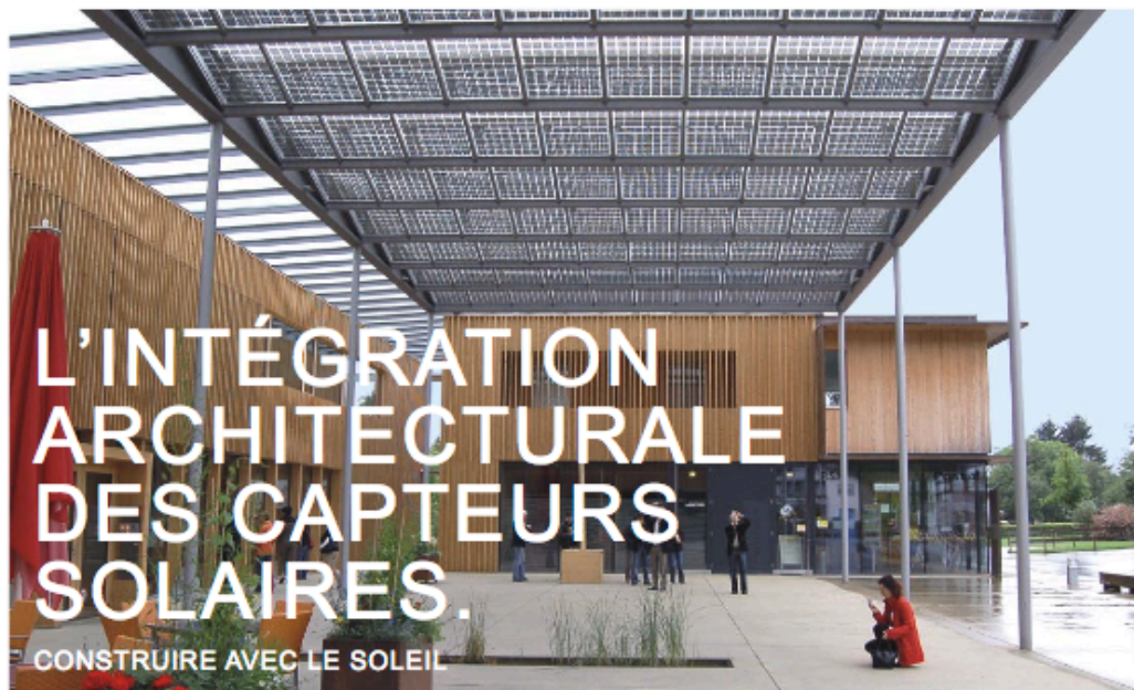
Un vélum de capteurs photovoltaïques abrite une place publique. Ludesch (Voarlbreg, Autriche)